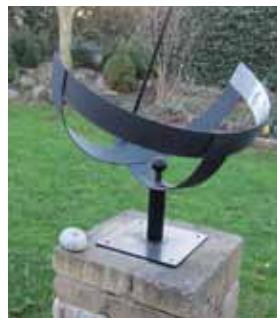
Et moderne havesolur

Et solur skal opstilles korrekt for at kunne vise timerne på vor breddegrad, og med skyggeviseren stillet i den rigtige vinkel. Det kan variere lidt om man ønsker et vertikalt solur på husmuren, eller et horisontalt, eventuelt på en søjle eller støtte midt i det grønne.