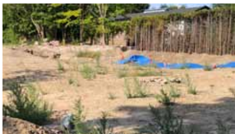
“Trümmerblumen” i fuldt flor

Den nuværende bygning fra 1881 stod allerede for knap 10 år siden for tur til grusbunken, men det planlagte femetagers-projekt standsede. Medio 2017 begyndte så et reduceret projekt med hurtig nedrivning af teatersal og endnu en ejendom bag det nu fredede tidligere hotel. Herefter gik projektet i stå – og naturens styrke viste sig ved stærke planter, der vandrede ind trods den tørre sommer og den ufrugtbare grund. Først ultimo 2018 begyndte der at ske noget.