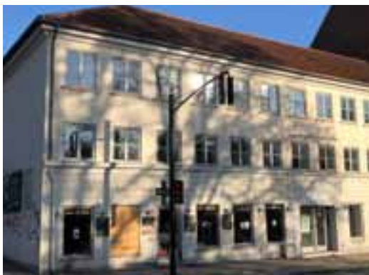
... endnu holder facaden mod Ordrupvej ...

nem de seneste knap 20 år, hvor jeg har boet i området. Sågar hele brancher som bankerne er forsvundet fra gadebil- ledet. Et altid trist syn er, når skiltet ”Til leje/salg” bliver sat op og står som et ildevarslende menetekel på gadens mangel på ”næring”. Tan- ken falder uvilkårligt på en mindre provinsby. Heldigvis er der dog nogle, der holder stand, som fx Or- drup Værktøjsmagasin, der gennem flere generationer har forsynet områ- det med alskens varer fra den mind- ste skrue til den største plæneklipper. Dertil kommer forretninger som fx Kystbanen med bl.a. Märklin, samt