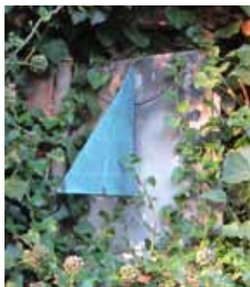
Soluret på Ordrupgaard