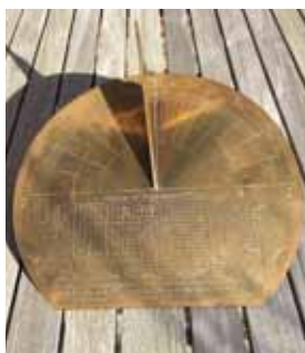
Solur for det engelske protektorat i Egyptien