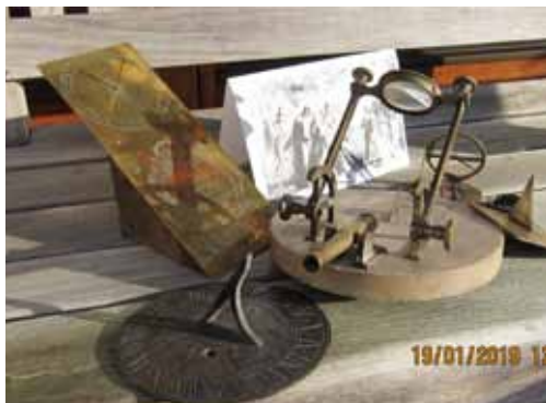
Middagskanonen, og andre solure

Ringene med den forskydelige ramme holdes op imod solen, som skinner igennem et lille hul i den ydre ring og belyser timetallet på den indre ring. Uden batterier, tandhjul og anden mekanik end vor livgivende sol.